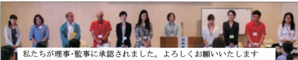
私たちが理事・監事に承認されました。よろしくお願いいたします

かし、地区から要望のある「おでかふえ」を継続するための3万円をはじめ、地区活動を応援する活動の費用として合わせて12万円を予算化しました。広く組合員からアイデアを募集しています。(HP・広報委員 木田洋子)